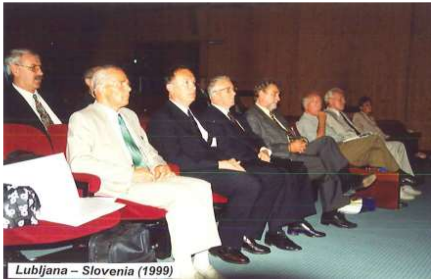
Władze Uniwersytetu w Ljublanie na czele z rektorem, prezydentami Ljubljany i Słowenii.