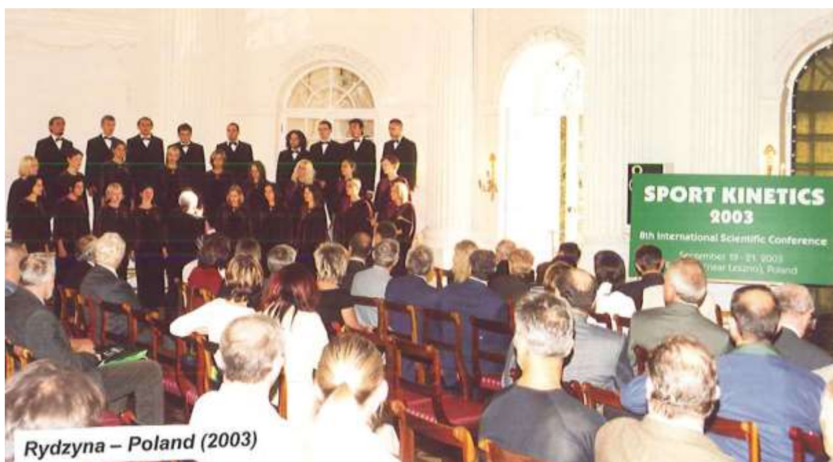
Podczas otwarcia konferencji wystąpił ze specjalnym repertuarem chór State School of Higher Vocational Education in Leszno (Polska).