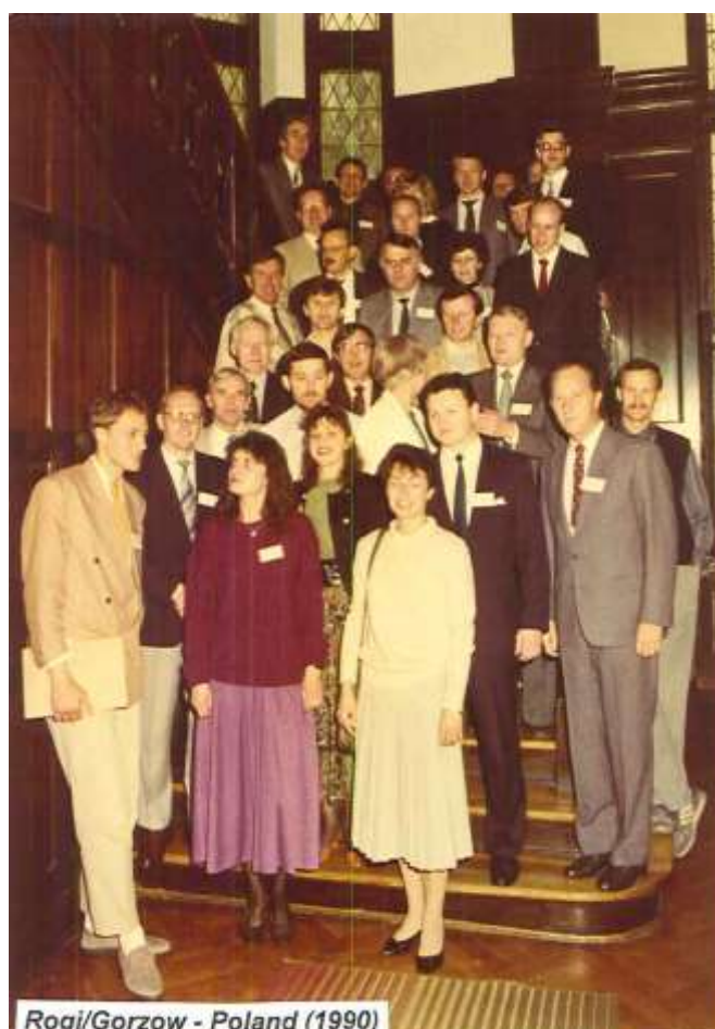
Uczestnicy I. Międzynarodowej Konferencji z serii „Sport Kinetics” pt. „Koordynacja ruchowa w sporcie” zorganizowanej w Rogach k. Gorzowa (Polska).