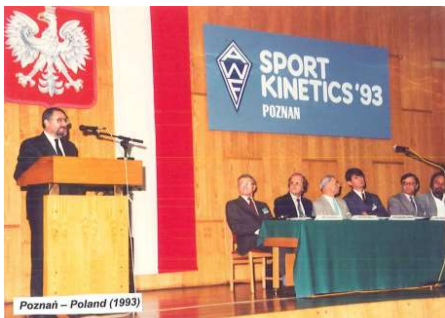
Podczas uroczystego otwarcia konferencji przemówienie wygłosił wice-premier RP, P. Łączkowski.