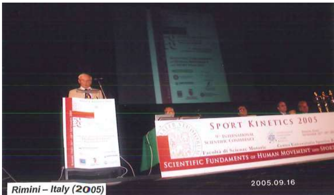
Przemówienie prezydenta IASK podczas otwarcia konferencji.