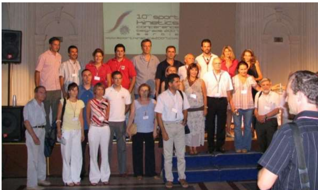
Pożegnalna fotografia uczestników ciekawej i inspirującej konferencji w Belgradzie.