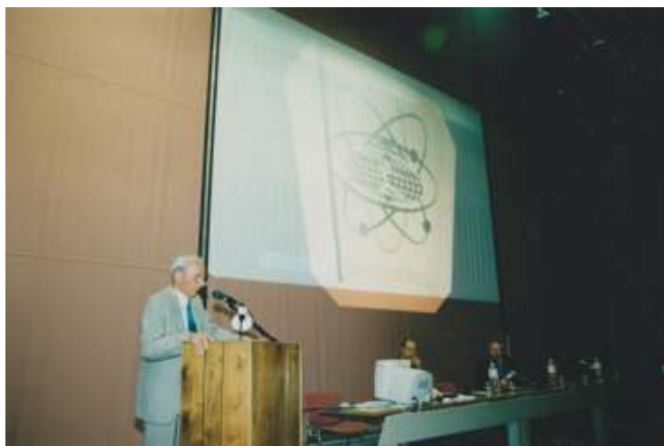
Uroczyste otwarcie obrad Kongresu przez Prezydenta International Association of Sport Kinetics w Bolonii, Włochy, (2000).

aspects of water feeling as perceived by national team competitors of rowing and kayaking.”; W. Starosta, E. Rostkowska: “The structure of water feeling and the hierarchy of its component elements in the opinion of swimming coaches.”; “Selected aspects of water feeling problem in swimming.”; W. Starosta, B. Felbur: “Test of special motor fitness for the advanced table tennis player.”; “Structure and conditioning of ball feeling in the opinion of table tennis players and coaches.”