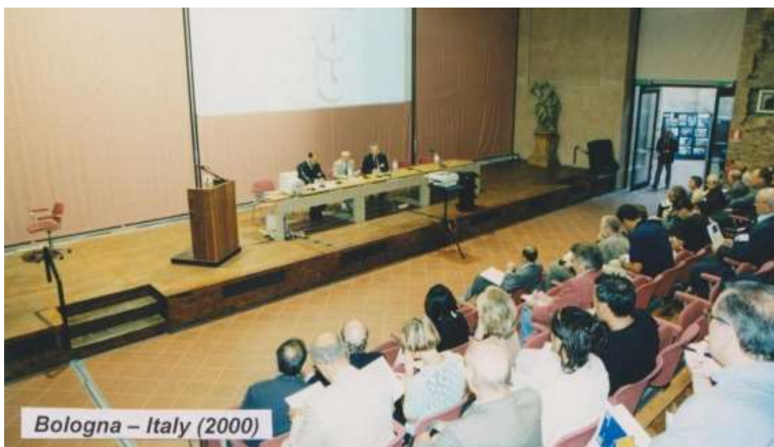
Widok na prezydium Kongresu i salę obrad.