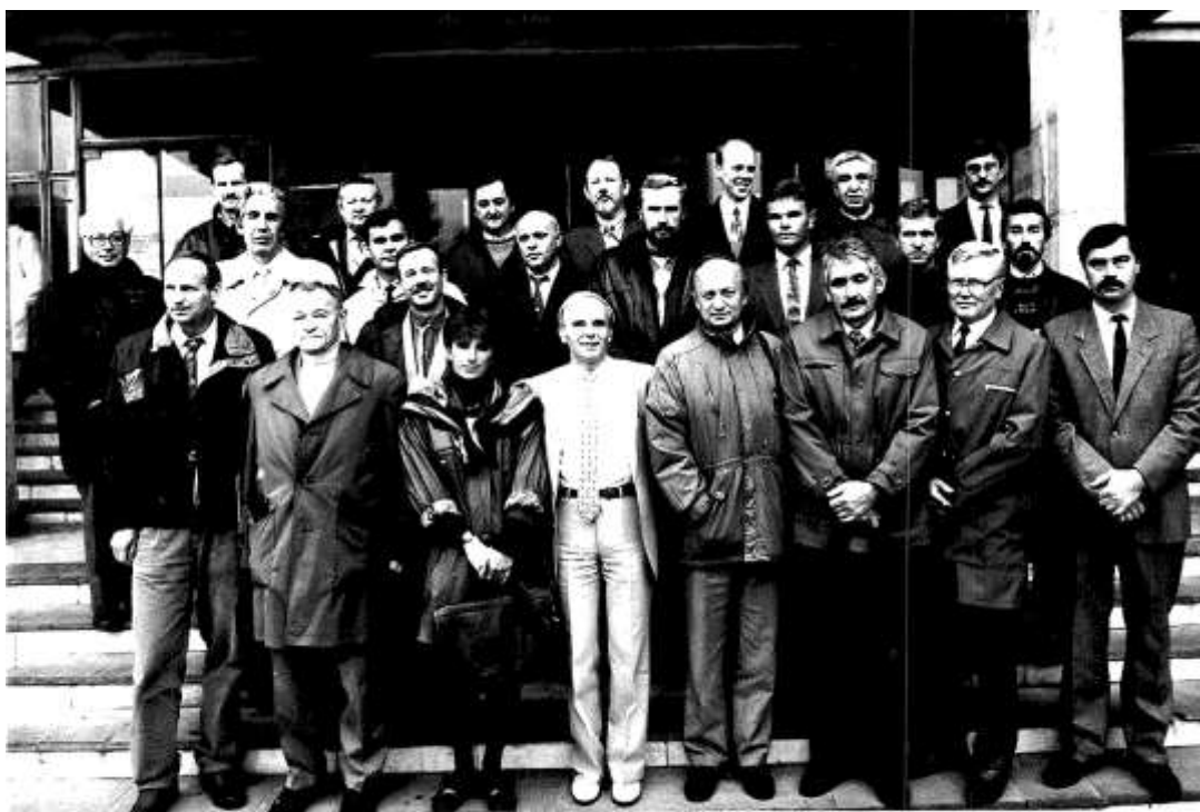
МЕЖДУНАРОДНАЯ НАУЧНАЯ КОНФЕРЕНЦИЯ – „ИЗБРАННЫЕ АСПЕКТЫ СПОРТИВНОЙ МОТОРИКИ” БРЕСТ 14-17.X.1992г.